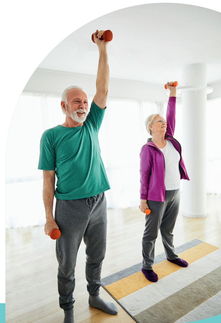
Stand: 6/2024

Eine Einrichtung der Evangelischen Heimstiftung GmbH